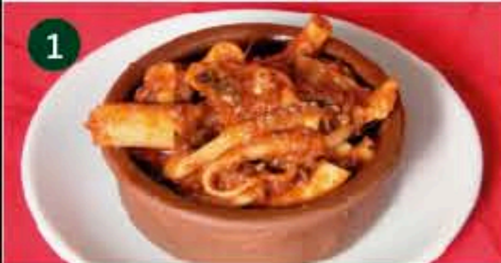
1 Los Arcos C/ HUERTO DE MAS, 6 Tapa: PULPO PICANTE