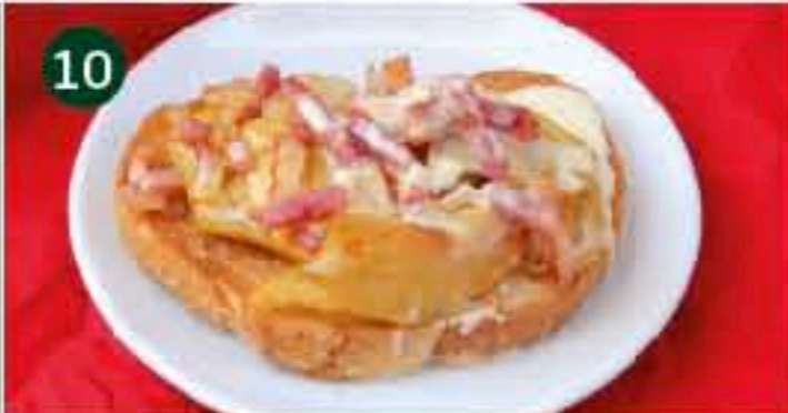
10 Trinquet C/ RUIZ VILA, 8/ ASSARAU Tapa: PATATAS SABROSAS CON CAMEMBERT