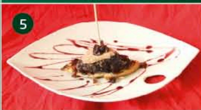
5 La Notaría C/ COLÓN, 16 Tapa: PINCHO DE COLÓN