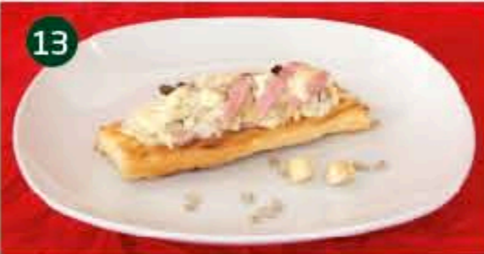
13 Cinema PIZ. LAS AULAS, 4 Tapa: BARQUETA DE ENSALADILLA DE ROQUEFORT Y FRUTOS SECOS