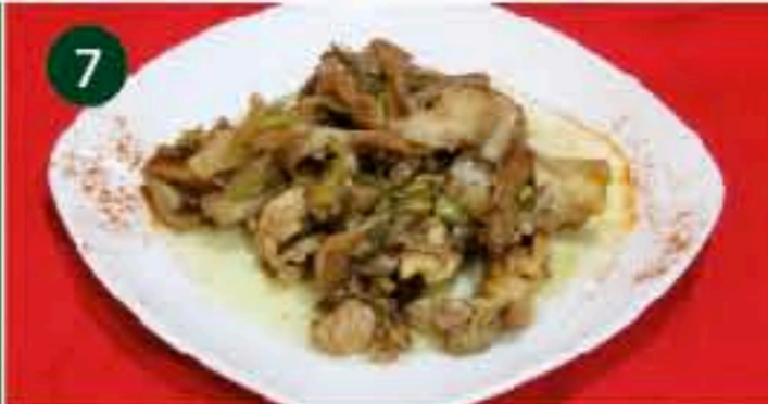
7 Bar San Fermín C/ HIGUERAS, 5 Tapa: CONEJO CONFITADO CON SETAS Y AJOS TIERNOS