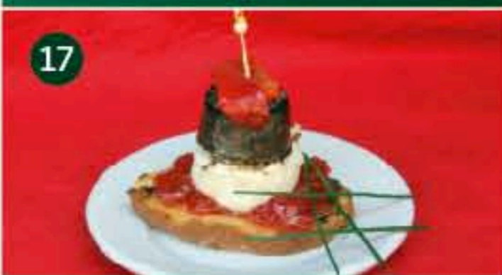
17 Lo de Pepe C/ ESCULTOR VICIANO, 13 Tapa: PINCHO DE MORCILLA DE BURGOS CON CON QUESO DE CABRA, MERMELADA DE TOMATE Y PIMIENTO CARAMELIZADO