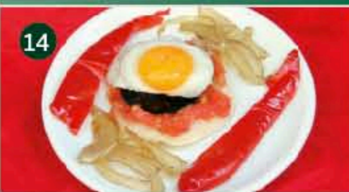
14 La Gayata C/ ENSEÑANZA, 3 Tapa: MORCILLA DE BURGOS CON HUEVO DE CODORNIZ