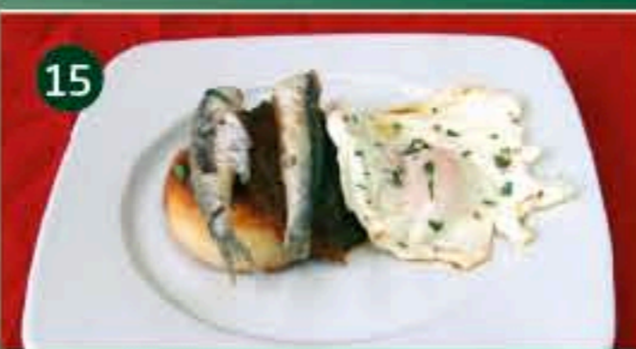
15 La Taberna del Guille C/ STO. DOMINGO, 1 Tapa: TORTITA AL HORNO DELICIAS DE NAVARRA, BOQUERÓN FRITO Y SU HUEVO