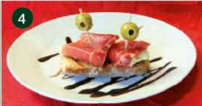
4 Café di Roma CL. MAYOR, 42 Tapa: MONTADITO SERRANO CON BRIE