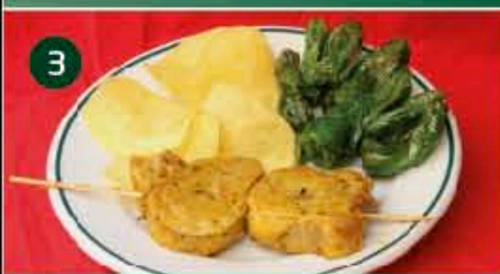
3 La Nécora C/ BARRACAS, 8 Tapa: PINCHO DE SOLOMILLO LA NÉCORA