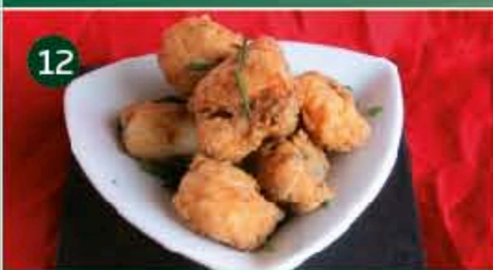
12 Rafa`s Bar C/ GUMBAU, 7 Tapa: BIEN ME SABE