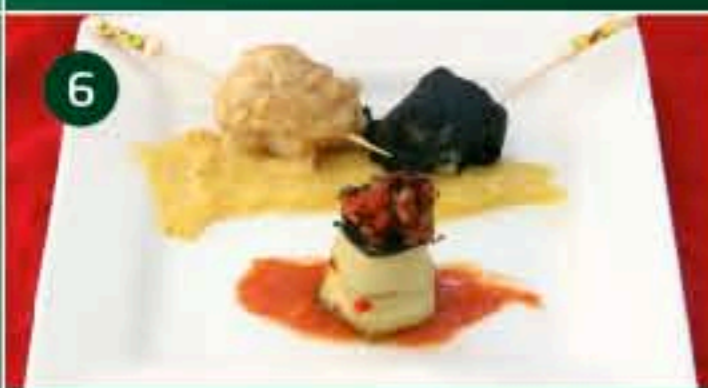
6 Caf. Centro C/ VERA, 8 Tapa: BACALAO ALBINEGRO CON REDUCCIÓN DE MANGO