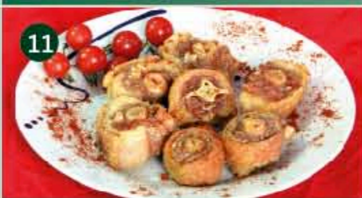
11 Casa Emiliano C/ CRONISTA REVEST, 11 Tapa: RABO DE CERDO FRITO