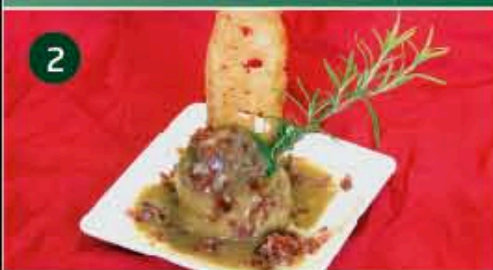
2 Snack Plaza C/ DR. MARAÑÓN, 3 Tapa: CARRILLADA IBERICA