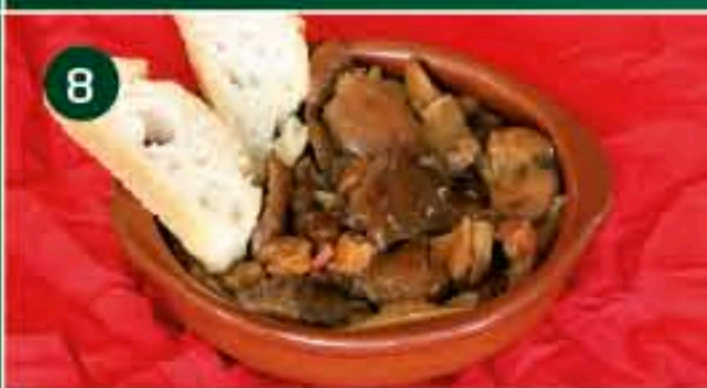
8 Castilla La Mancha C/ TORRELASAL 6 Tapa: ROBELLONES A LA CASTELLANA