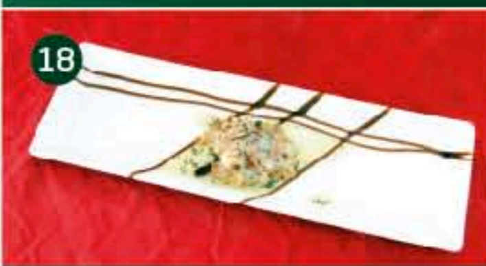
18 Gin & Vin C/ GOBERNADOR, 53 Tapa: RABIOLI CON GAMBAS