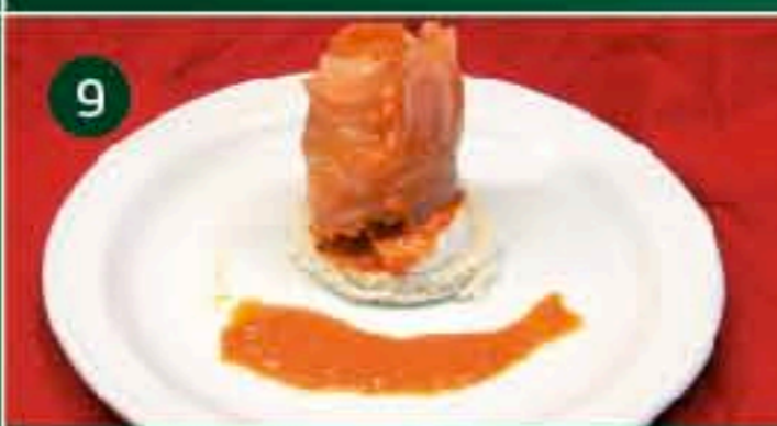
9 La Almazorina C/ GOBERNADOR, 87 Tapa: CAPRICHOS DE SALMÓN